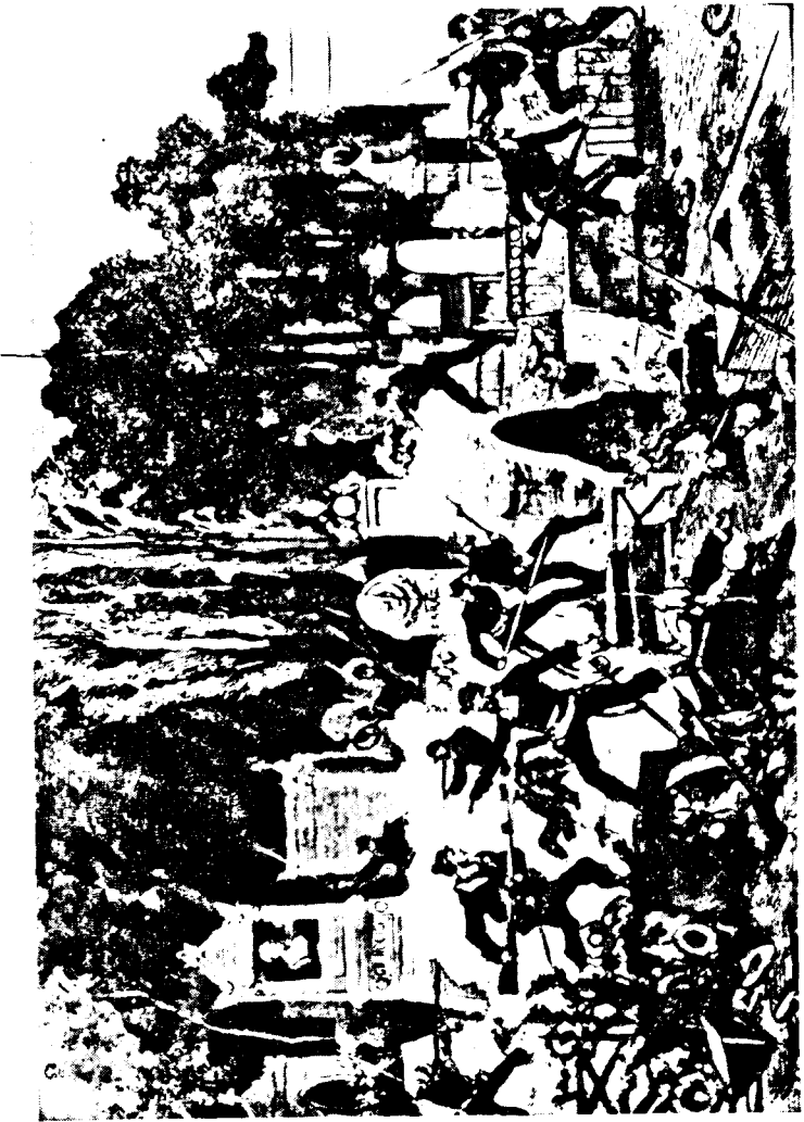
పరిశుభ్రత కార్యక్రమం వల్ల నగరం కు మంచి మార్పులు