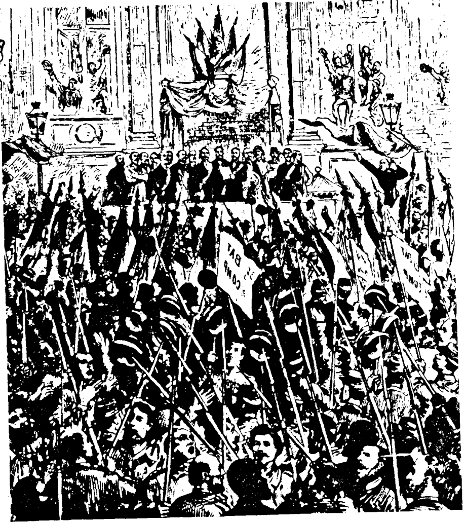
పారిస్ నగర పాలకకార్యాలయంలో 1871 మార్చి 28న కమ్యూన్ ప్రకటించబడిన పుళ్ళం