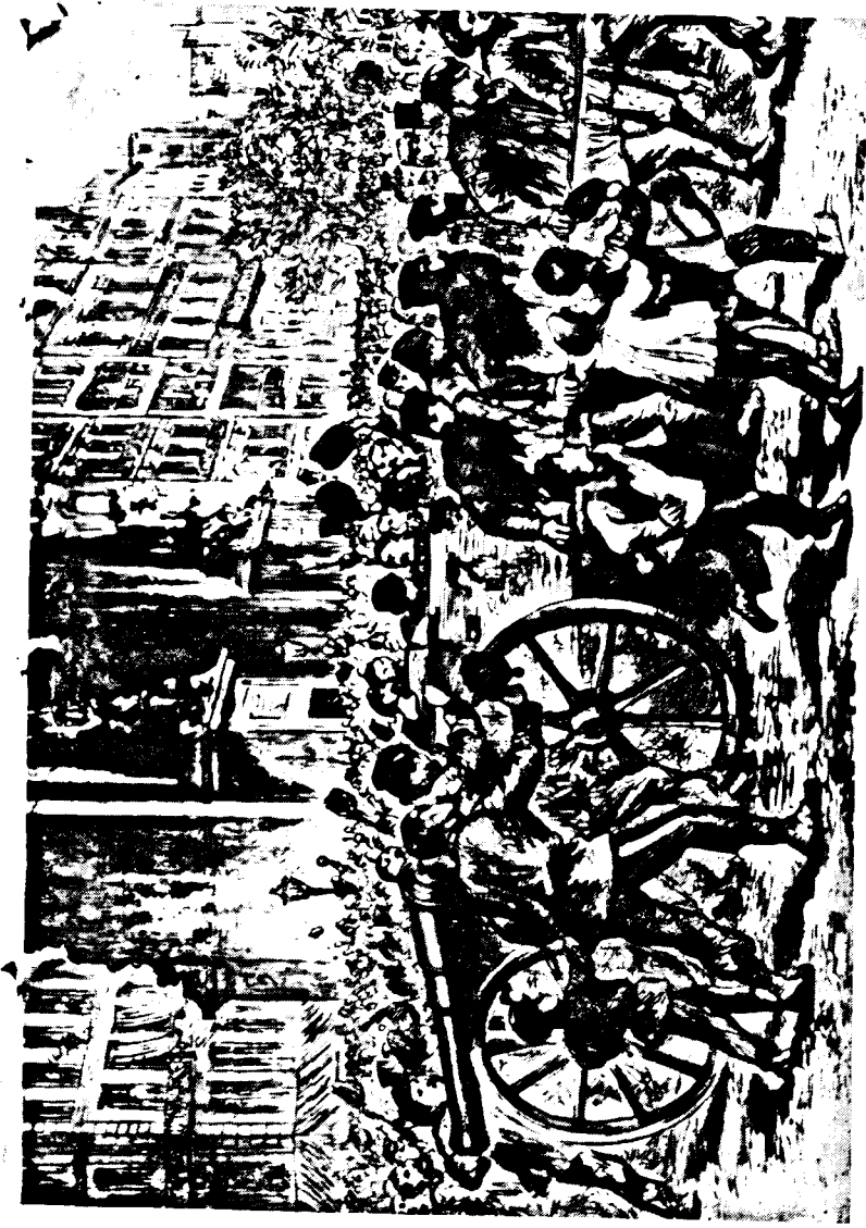
1871 మార్చి 18న మాంస్టర్‌వద్ద శత్రువులను పట్టుకోడానికి ప్రయత్నించిన శ్రీర్ పోలీసులను, సైనికులను తిరుగుబాటు చేసిన జనాలు వెళ్లగొట్టుతున్న దృశ్యం