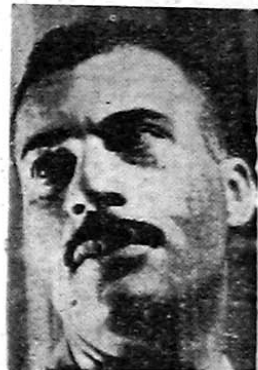
Deputado Carlos Marighella

ta, pretendem cassar os mandatos dos comunistas tentativa desesperada de reduzi-los ao silêncio.