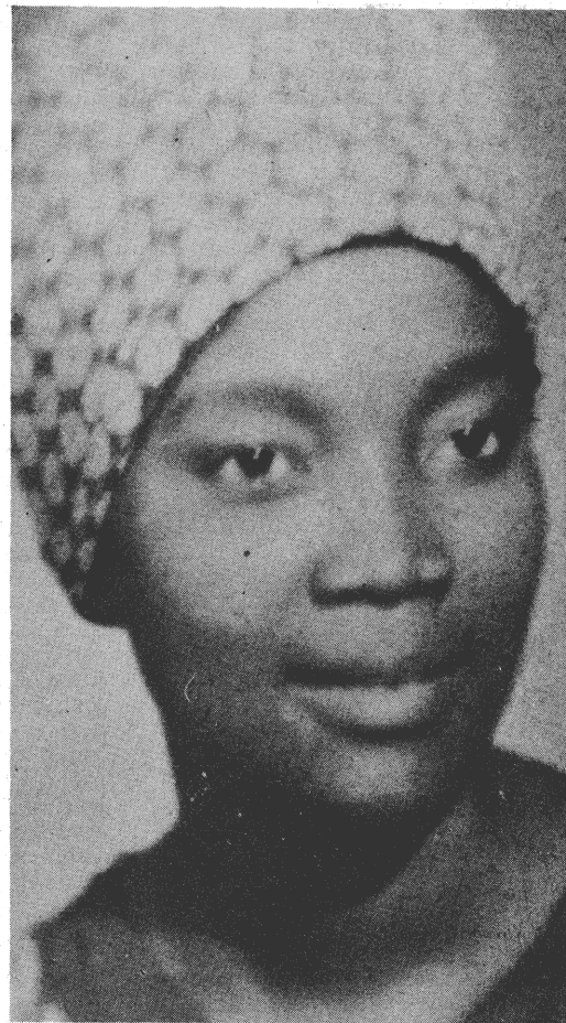
Josina Machel: «A tua vida continua nos continuadores da revolução»