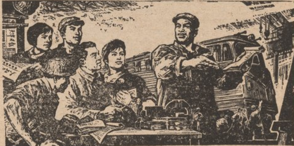
UN GRUPO TEORICO DE OBREROS EN LA REPUBLICA POPULAR DE CHINA.

La Federación Americana Laboral por supuesto despues traicionó a la clase obrera y colaboró con la burguesía en promoviendo "Labor Day" en septiembre como el día de fiesta de los trabajadores. Han tratado de separar al proletariado de los EE.UU. de sus hermanos y hermanas internacionales y substituir un día inofensivo de jiras, en vez del gran día de solidaridad internacional de clase.