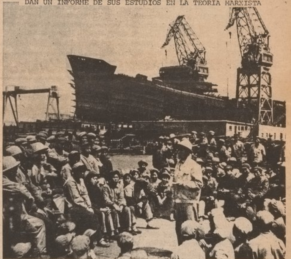
EN UNA REUNION DE LOS OBREROS EN CHINA, LOS OBREROS DAN UN INFORME DE SUS ESTUDIOS EN LA TEORIA MARXISTA