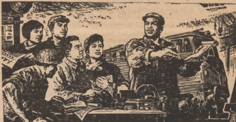
A workers' theoretical group.

"No, I don't consider these people to have been found guilty of any offense but they must be hanged, I'm not afraid of anarchy; Oh, no, its the Utopian scheme of a few philanthropic cranks, who are amiable withal, but I do consider that the labor movement must be crushed. The Knights of Labor will never dare to create discontent again if these men are hanged". (Foner-page 111)