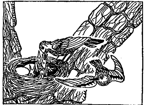
Lintu-äiti ruokkii lapsiaan

“Mutta linnut syntyvät siten, että äitilintu munii pesäänsä ja kuka tahansa voi nähdä ne munat, ennenkuin niistä on lintu ulos tullut. Eläimissä täytyy myös täten pikkueläinten kehittyä munassa, joka on kasvanut äiti-eläimen ruumiissa. Muissa eläimissä kuitenkin säilyy muna äidin ruumiin sisällä senkin jälkeen, kun se on hedelmöitetty, kunnes uusi pikkukissa, tai varsa, tai pikkukarhu on kasvanut kyllin voimakkaaksi, syntyäkseen maailmaan. Niinkuin kananmunat alkavat kehittyä kanan sisällä, niin alkavat kaikkien eläinten pentujen kehitykset munassa äiti-eläimen sisällä. Nyt sinä ehkä haluaisit tietää, kuinka äidin sisällä olevat munat tulevat hedelmöitettyiksi.