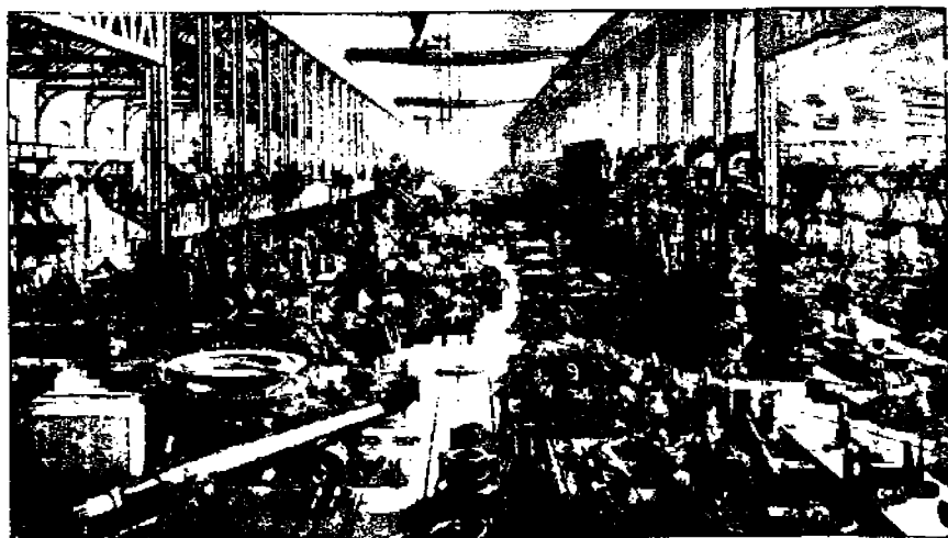
Ameriikkalainen ase tehdas. Bethlehemin teräsyhtiön tehdashuone no: 2. Tämä huone on 1,800 jalkaa pitkä ja valmistetaan sinä minuuttia.

Ihastuneena koko maailma kuunteli aikoinaan Yhdysvaltain presidentti Wilsonin esittämiä neljäätoista pykälää, joiden mukaan maailman piti vapautuman militarismihirviön kahleista. Wilsonin ehdotuksien mukaan kansojen aseista