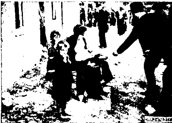
Kodittomia belgialaisia Antwerpenissä.