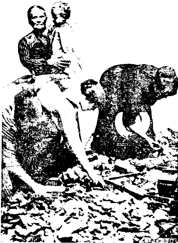
Louvalnee'n perhe kotinsa raunioilla

toja tuotteistaan tämän sodan kautta. Rautatiekomppaniat eivät myöskään missään tapauksessa jätä itseään osattomiksi. Ei riipu enään ollenkaan siitä, tuleeko valtioiden-välinen kauppakomissioni myöntymään rahtimaksujen korot-