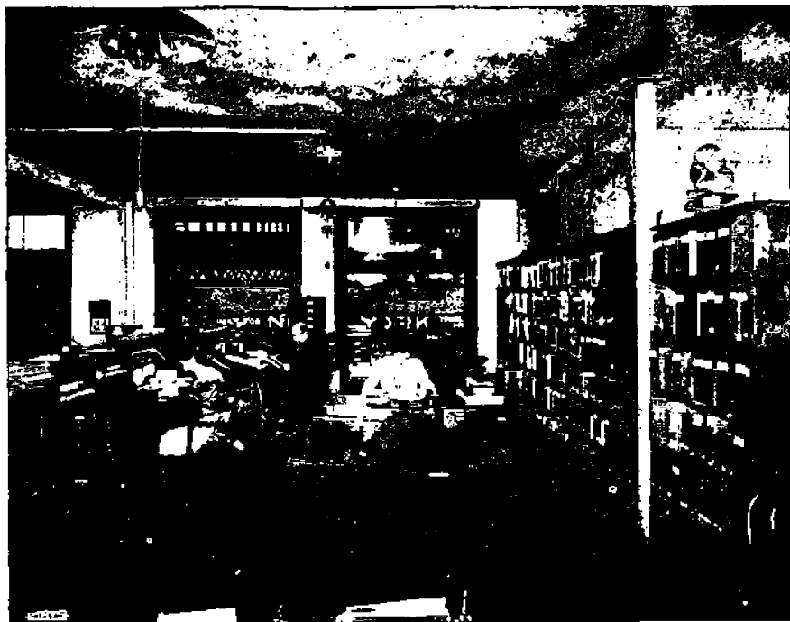
Sos. puolueen tiedonantotoimisto

lalle, Lehti on nopeasti alkanut levitä ja sillä on nykyään 17,000 tilaajaa. Se sisältää paitsi virallisia tiedonantoja, lyhyitä uutisia työväenliikkeen eri aloilta. Toivokaamme, että siitä muodostuu perustus puolueen omistamalle varsinaiselle sanomalehdelle, jollainen kipeästi tarvitaan. Amerikalaisilla puoluetovereilla on kummallinen kammo puolueen omistamaa sanomalehdis-