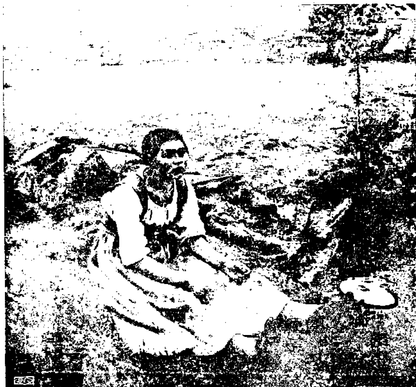
Lepohatki, Jules Bastien-Lepage.

työnsä vasta alussa. Hänellä oli vielä paljon työtä Iron Rocks'issa ennenkuin villityksen siemen, jonka hän jo tosin oli kylvänyt, tässä maaperässä menestyy ja tuottaa satakertaisen sadon. Siementä on vielä vaalittava ja kylvettävä lisää. Hän oli sosialisti-agitaattori, muttei ollut kertakaan vielä Iron Rocks'issa asi-