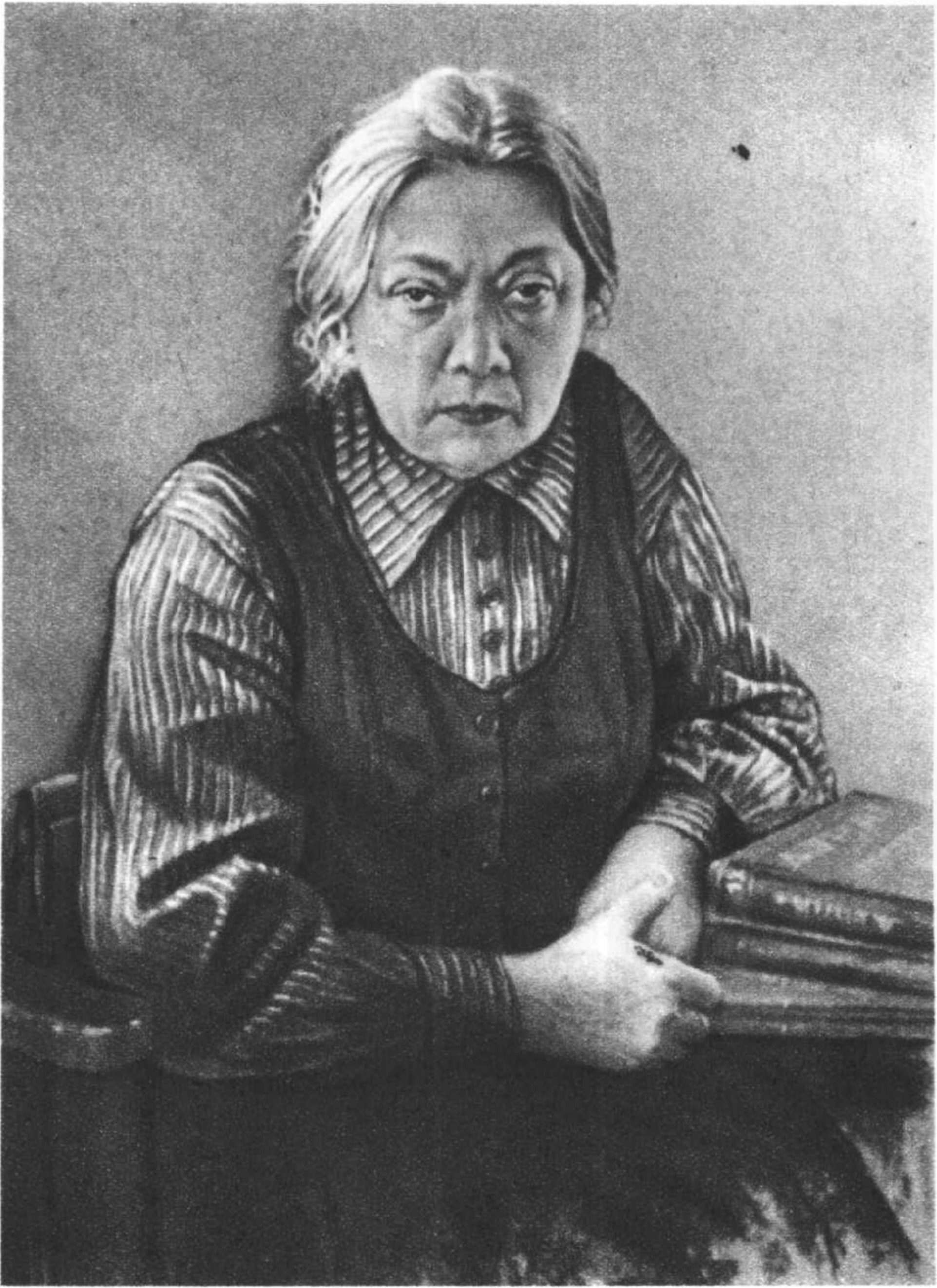
娜·康·克鲁普斯卡娅