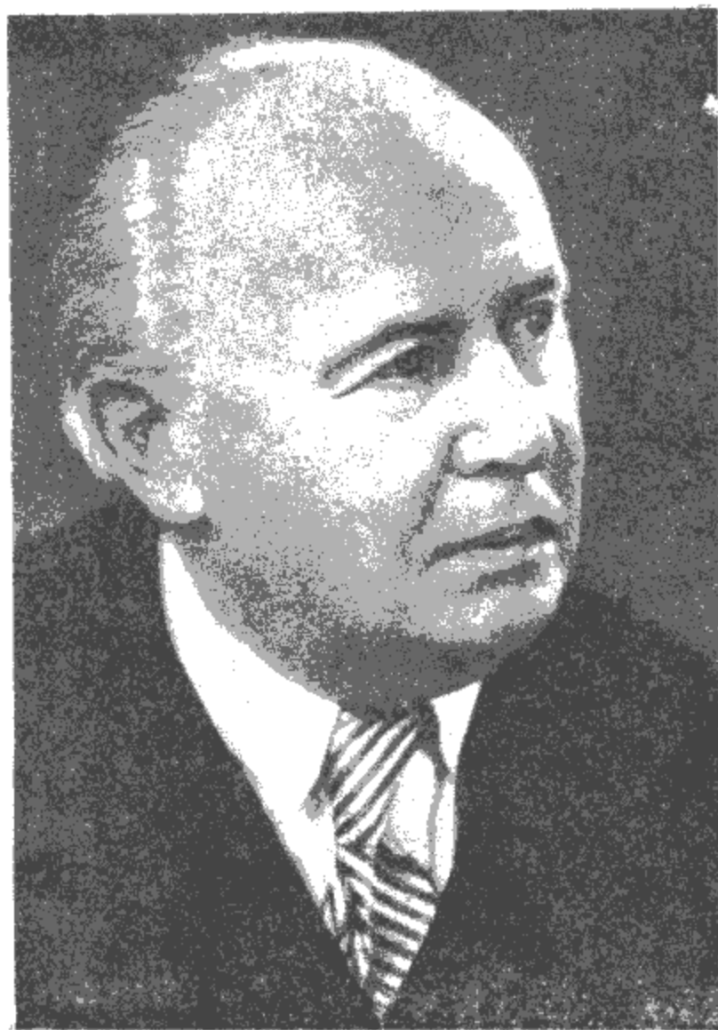
作 者 像